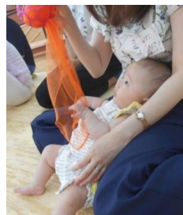
なんだなんだ…？ ひっぱってみようかな…