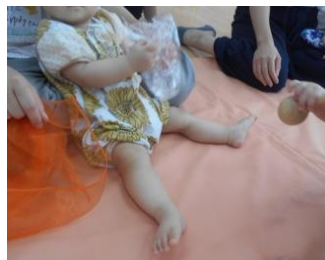
布よりも入っていたビニール袋の音や色、手触りに興味あり♪