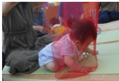
シフォンの布を使って遊ぼう！

ここはクッションフロア（床暖房付）。じかに座ることを前提に作られた部屋ですが…マットのある場所に座りたくなるもの。とくに初回はギュッと集まります。