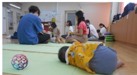
床の上でこんなにぐっすり眠るなんてびっくり！とお母さん。 心と身体をめいっぱい動かしてよく遊ぶとよく眠ります。